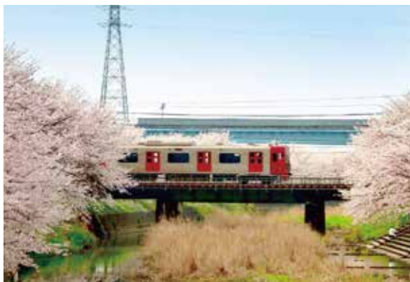
大きな駐車場がないので、波多江駅から川沿いを散歩するのがおすすめ。

JR 筑肥線の波多江駅と筑前前原駅の間には、3月16日に新しい駅「糸島高校前駅」が開業します。より快適に、ますます賑わいを見せる活気ある糸島。お彼岸のお墓参りや見学で当園にいらっしゃる際には、ぜひ糸島の春の風景もあわせてお楽しみください。